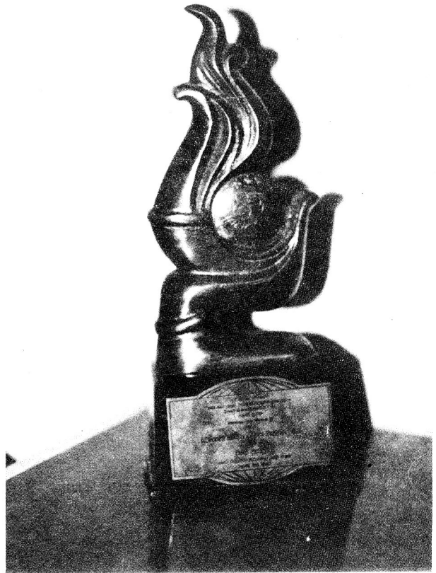
විශ්ව ප්‍රසාදිති සම්මානය