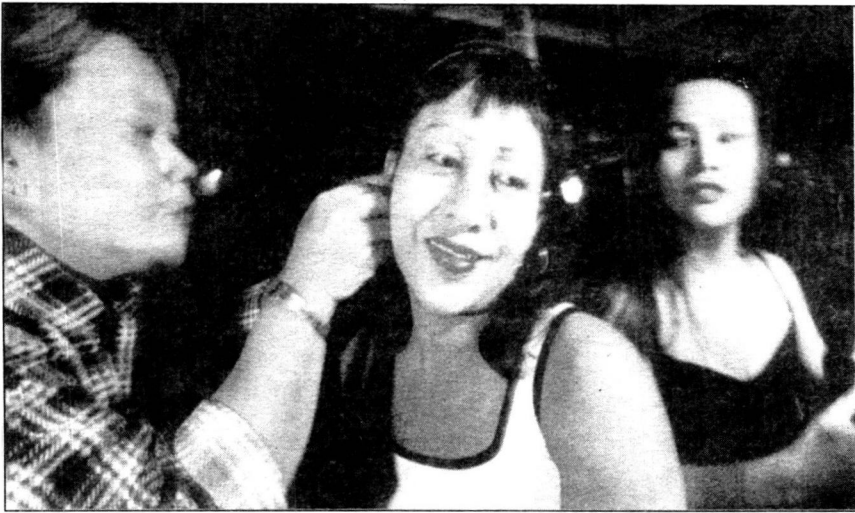
සලේගා, නුතනුණු ශල්‍යවේද්‍යවරයෙක් විශ්වාස කළ අතර ඇගේ කළවා වලට සිදුවූ හානිය හිසා නඩු පැවරූ සුවන්ප්‍රදීප නම් වූ හිසිය

වඩා හොඳ පෙනුමක් ඇති පුද්ගලයා නිවැරදිව තෝරා ගනු ඇති ආර්ථික අවපාතවලට හසුවූ තාසිලන්ත රජය පවා ජ්‍යෙෂ්ඨ ශල්‍ය කර්මවල මුදල් ඉපයිය හැකි විභවය අවබෝධ කර ගෙන සිටියි. එහි සංචාරක අධිකාරිය විදේශික සංචාරකයින්ට ජ්‍යෙෂ්ඨ සැත්කම් කිරීම සඳහා යම් ආයතන වලට සහාය පළ කරයි. බැංකොක් හි තදබද වූ විදියක් ආශ්‍රිතව තවදුරටත් 12 වූ ඩොලර් මිලියන 90 ක් වූ රෝහල තරු පහේ ජ්‍යෙෂ්ඨ සැත්කම් කම්හලක් වැනි ය. මෙහි