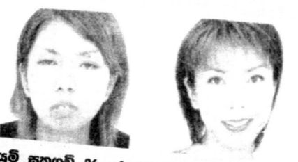
යුම් කකුබ් 26, ජපන් ජාතික ඇගේ පෙනුම නිසා අකාරුණික ලෙස පීඩාවට පත් වූවාය. ඩොලර් 30 000 මිල වූ ශල්‍යකර්මයකින් පසුව ආකර්ශනීය පෙනුමක් ලබා සිටියි.