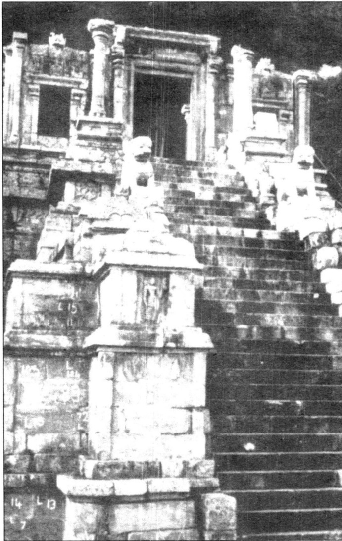
කි. ව. 14 සියවස - යාපහුව විසිතුරු දෙරටුව

මේ මතවලින් ක්‍රමයෙන් පුරාවිද්‍යාව වර්ධනය වූ ආකාරයත් මිනිසාගේ දැනුම වැඩි ගිය ආකාරයත් පැහැදිලි ය.