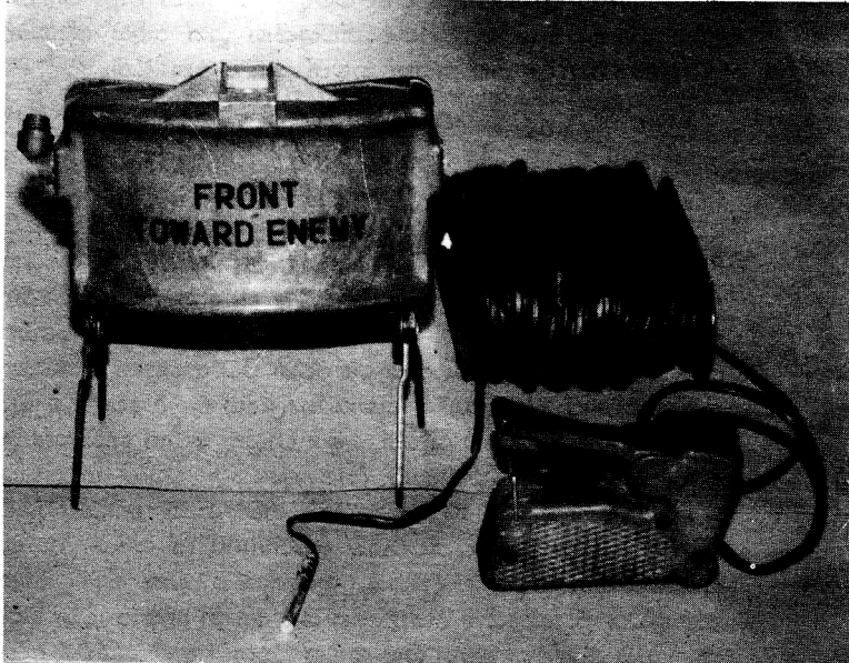
පිරිස් විරෝධී බෝම්බය

එය පරිහරණය ආරම්භයේ දී දැනුනද කෙමෙන් මගහැරී යයි. පළුදු නොවූ සම තුලින් පවා එය අවශෝෂනය විය හැකි වන අතර, එමගින් අත්ලෙහි පැළුම් තුවාල හටගත හැකිය. එහෙත් සාමාන්‍යයෙන් ප්‍රවේශමෙන් යුතුව ඩයිනමයිට් පරිහරණය කිරීමේදී නයිට්‍රෝ ග්ලිසරීන් වලින් ඇති වන්නේ තාවකාලික අපහසුවකි. එයින් ශරීර සෞඛ්‍යයට බරපතල හානි සිදු නොවේ. කල්ගතවීමෙන් පරිහානියට පත්වූ ඩයිනමයිට් පරිහරණයේදී එහි හදිසි ස්වයං ප්‍රස්පෝධනය වීමේ අවදානම අධික වන බව මතක තබා ගැනීම වැදගත්ය. ට්‍රයිනයිට්‍රෝ ටොලයින් බහුලව භාවිතාවන යුධ පුපුරුණ ද්‍රව්‍යයක් වන අතර එය අවරණ හෝ ලා කහ පැහැති ඝන ද්‍රව්‍යයකි. මේවා (monoclinic) ස්ඵටික ස්වරූපයකින් පවතී. අත් බෝම්බද, අහසින් එවන බෝම්බද, නිෂ්පාදනයේදී මෙය ප්‍රධාන පුරවනය වශයෙන් පුළුල් ලෙස භාවිතා වෙයි. වැඩි වශයෙන්ම R.P.G. රොකට්ටු, යුධ වැංකි විනාශ කරන බෝම්බ ටෝපිඩෝ සහ ග්‍රෙනේඩ් බෝම්බ නිෂ්පාදනයේ දී යොදා ගන්නා 'composition B' නමින් හැඳින්වෙන ප්‍රයෝජනවත් අධි ස්පෝධක ද්‍රව්‍ය නිපදවීමේදී මෙය භාවිතා කෙරේ. දිවයිනේ උතුරු ප්‍රදේශයේ ආරක්ෂක හමුදා වලට මහත් නර්ජනයක්ව ඇති "ජොනි" බෝම්බ