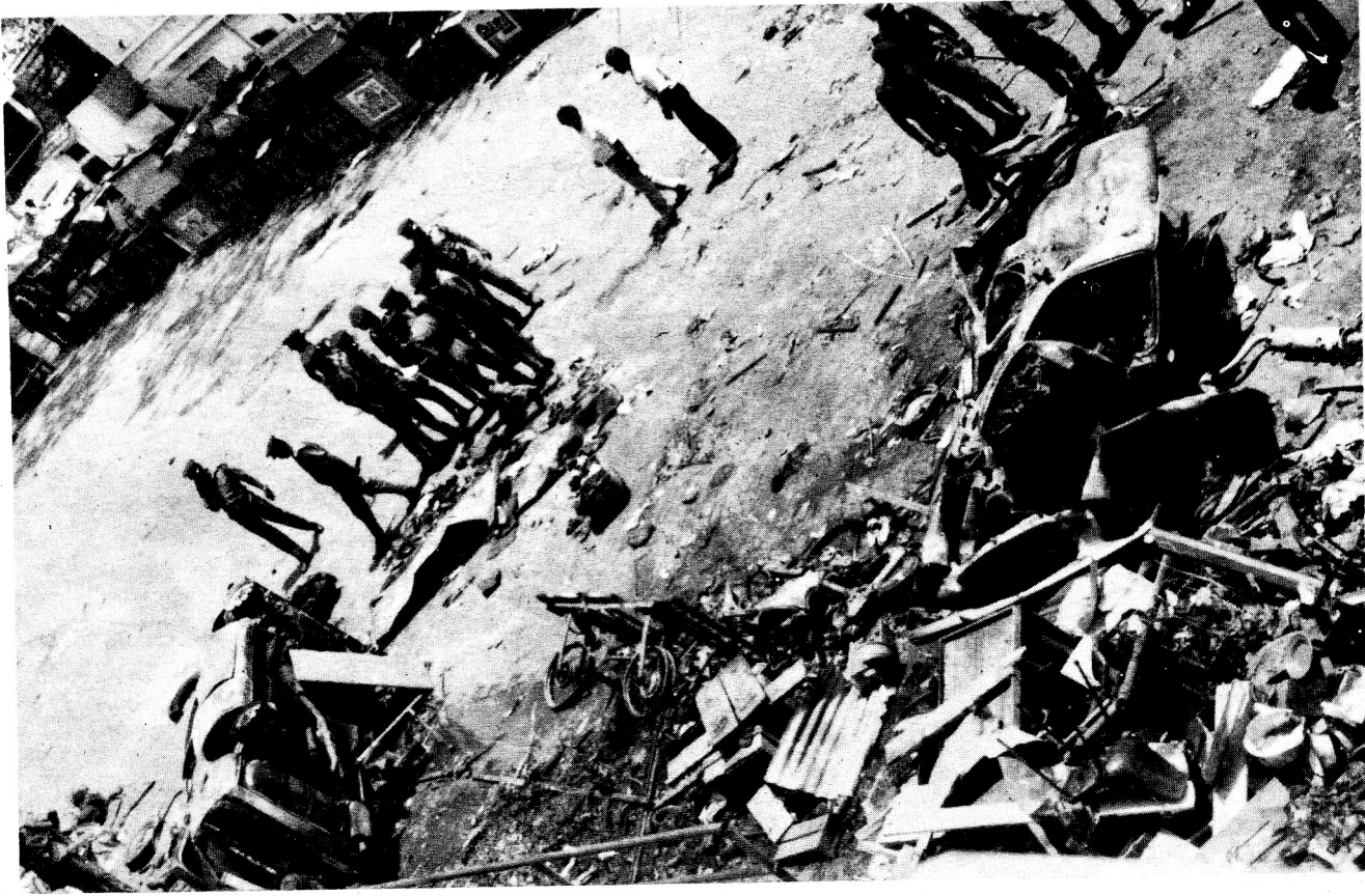
බෝම්බ පිපුරුමක ප්‍රතිඵල

කෙසේ වුවද, පාඨකයින් විසින් කිසිවිටෙකත් පුපුරණ ද්‍රව්‍ය හෝ අන්ති තාක්ෂණය (pyrotechnics) සම්බන්ධයෙන් කිසි විටෙකත් අත්හදා බැලීම් නොකළ යුතු බව මතක තබා ගැනීම අතිශයින් වැදගත්ය. මක්නිසාද යත් මෙහිදී අත්වැරදි වලට කිසිදු ඉඩක් තැබිය නොහැකි හෙයිනි. එමගින් හයානක පිපිරීම්ද, පාලනය කළ නොහැකි දරුණු ගිණිගැනීම්ද හට ගැනීමට ඉඩ ඇත.