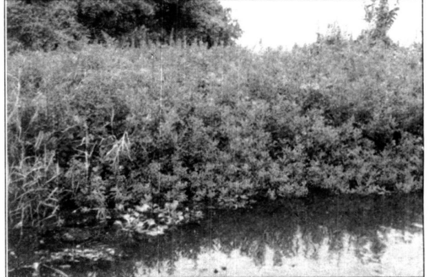
මුතුරාජවෙල මැවෙන පරිසර සංරක්ෂණ කොටසට අයත් මීගමු කලපුවේ කඩිත් කඩ පිහිටි වගුරු බිම්ක ඇදුම රෝගයට ප්‍රතිකාර සඳහා අවශ්‍ය කටු ඉකිලිය නමැති බේතෙත් ගස වර්ගය