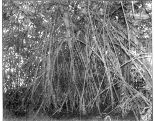
කඩොලාන ගසක මුල