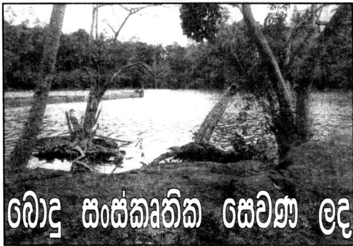
බලද සංස්කෘතික සෙවණ ලද

මහ පාලම මැදින් ගලා එන මාදු ගඟෙහි බලපිටි මෝදර