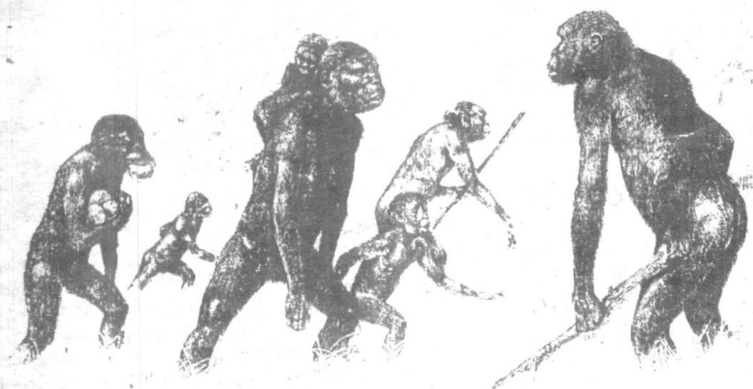
මස්තෙලෝපිතූකස් නම් වූ ප්‍රාථමික මිනිස් විශේෂය වර්තමාන මිනිසා ගේ ඇත නැසියෝ ය.

බව කියන, ඉංග්‍රීසි ජාතික වාර්ල්ස් ධාවිත ගේ පරිණාම වාදයේ ස්වභාවික වරණ වාදය (Natural Selection) යි. ජීව සම්භවය සහ පරිණාමය ගැන, ක්‍රිස්තෝදයට පෙර හය වැනි සිය වසේ විසූ මිලිටස් හි ඇතකිසි