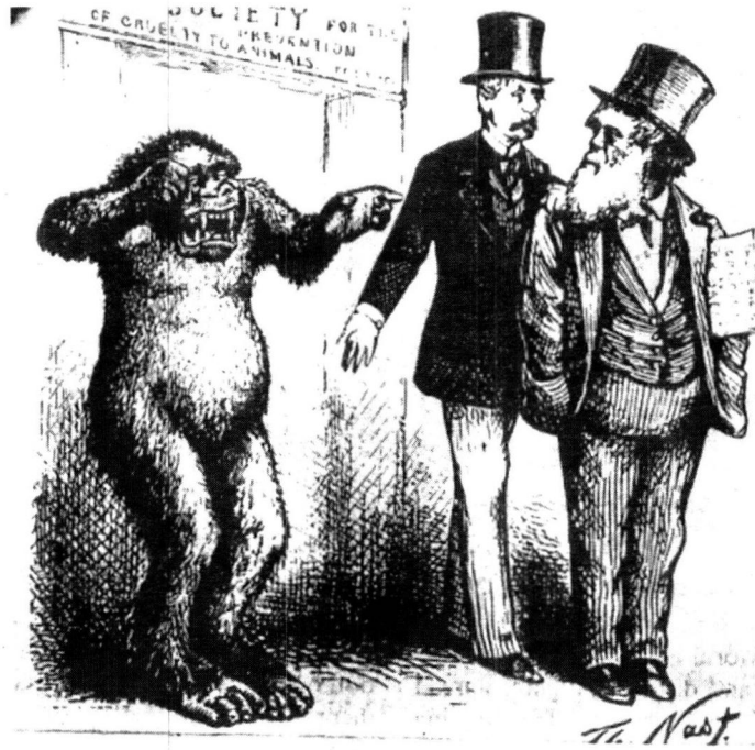
ඩාවින් (දකුණේ) ගේ පරිණාම වාදය ගෝරිල්ලා ගේ දුකට හේතු වී ඇති සෙයකි. (1871 විකට චිත්‍රයකි)

තම වූ ඒ කුඩා නගරය මුළු අමෙරිකාවේ ම ප්‍රසිද්ධ වන්නට විය. පරිණාමවාදය පිළිබඳ තඩු විභාගය තුරුමට එද විශාල ජනකායක් අධිකරණයට රොක් වූහ. ජනමාධ්‍යවේදීන් පමණක් 100 කට අධික විය. 1927 ජූලි 10 වැනි ද ප්‍රාදේශික ව පැවැති විශාල කාලගුණය මැද තඩු විභාගය ආරම්භ විය.