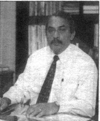
රූපවාහිනී සංස්ථාවේ අධ්‍යක්ෂ ජෙනරාල් අශෝක පීරිස් මහතා

හතකම ගුණාත්මක බව වර්ධනය කරන්නටත් විශේෂයෙන්ම ලමා වැඩසටහන් ගැන අවධානය යොමුකරන්නටත් මං බලාපොරොත්තු වෙනවා. උදහරණ වශයෙන් ගුරුගෙදර අධ්‍යාපන වැඩසටහනට මීට පෙර තිබුනේ සතියට එක් දිනයයි. දැන් සතියට දින දෙකක් එය පැවැත්වෙනවා. විසි එක්වැනි සියවසට ඔබින පරිගණක, ඉන්ටර්නෙට් වැඩසටහන් රැසක් ම ඉදිරිපත් කිරීමට බලාපොරොත්තු වෙනවා. අපේ නව ඇමතිවරයා වන අනුර ප්‍රියදර්ශන යාපා මැතිතුමාගේ මගපෙන්වීම යටතේ ලොකු ශක්තියක් අපට ලැබෙනවා. මේ ඉදිරි ගමන යන්නට.