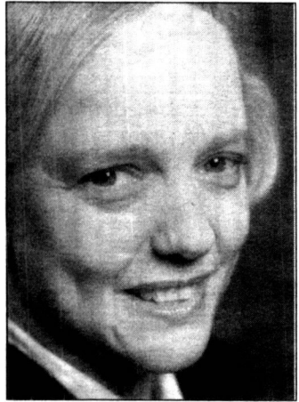
වෙන්දේසි පොළක් - මෙහාගෙන්

පසුගිය කාලයේ ධයනා කුමරියගේ මරණය සමග ලොවපුරා ජනතාව සේකය පළකළේ අන්තර්ජාලය සමග එක්වෙමිනුයි. යෝක වූ ජනතාව තම හිතවතුන්ට තත්තල් හැඟී යෑවීම සඳහා ඇතවුම කළේ අන්තර්ජාලය මගිනුයි. දැන් හැම දෙයකට ම මෙම