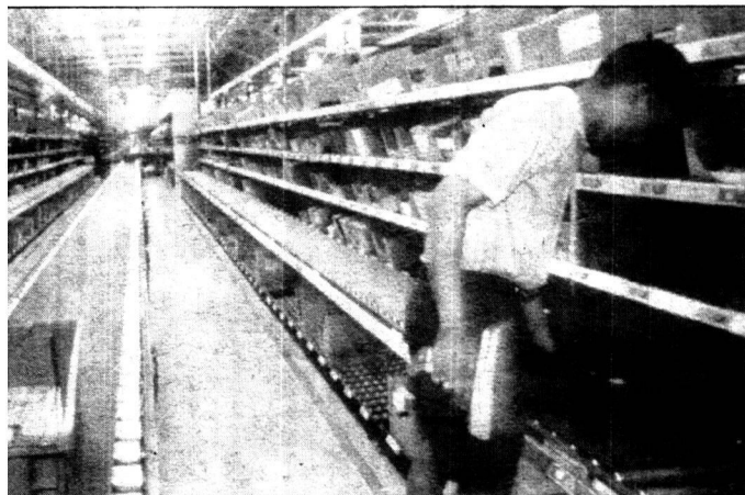
2000 දී බඩු භාණ්ඩ ගබඩාවක්

ලොව පුරා ජනතාව මෙතෙක් සාප්පු ගිය ආකාරය ජේෆ් බෙයෝස් අතින් කෙතරම් ලොකු පෙරළියකට ලක්වුණ ද කිවේත් 2000ත් එහා ලෝකයේ දී අපට අද දකින සාප්පු, ප්‍රදර්ශන ශාලා දක්නට නොලැබෙනු ඇත.