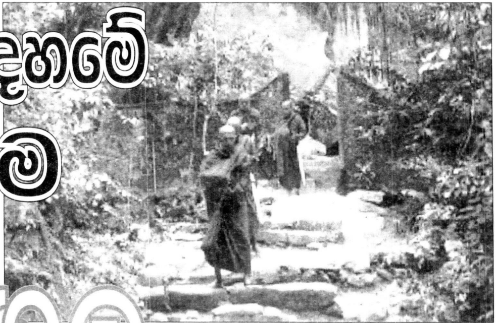
දනයව වඩින යෝගාවචර හික්සුන් වහන්සේලා