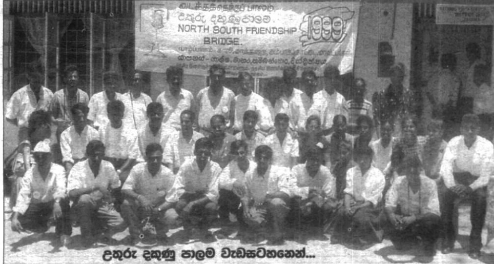
උතුරු දකුණු පාලම වැඩසටහනෙන්...