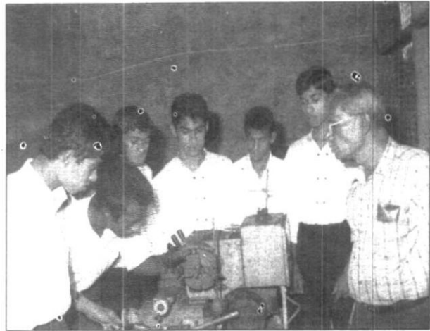
පොල්ගොල්ල වෘත්තීය පුහුණු මධ්‍යස්ථානය

කැපීම, කෘෂිකර්මය, ඇඳුම් කැපීම හා මැසීම, ආහාර සැකසීම, කර්මාන්ත ශාලා මැනුම්, විද්‍යුත් තාක්ෂණය, වොලිබෝල්, දූල්පන්දු හා කබඩි (කාන්තා/පිරිමි) ලියවන පට්ටල් වැඩ, පෙදරේරු, බටහිර සංගීත පුහුණු පාඨමාලා ආදිය ඇතුළුව තවත් විශාල පාඨමාලා ප්‍රමාණයක් මේ අතර වෙයි. මධ්‍යස්ථානවලට අමතරව පුහුණු කටයුතු සඳහා ක්ෂේත්‍ර මට්ටමේ වෙනත් කර්මාන්ත ශාලාද උපයෝගී කරගනු ලැබේ. මීට අමතරව පුහුණු මධ්‍යස්ථාන ආශ්‍රිත ගොවිපලවලදී තරුණ පිරිසට ධාන්‍ය වගාව, ගෙවතු වගාව සහ සතුන් ඇතිකිරීම පිළිබඳවද පාඨමාලා පැවැත් වේ.