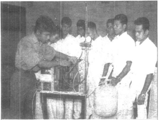
මහරගම වායුසම්බන්ධතා පුහුණුව ලබන සිසුන්