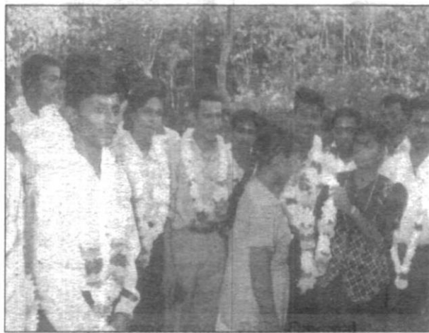
උතුරු දකුණු පාලම වැඩිකටහනෙන්...

ප්‍රාදේශීය ලේකම් කාර්යාලයේ සිය සේවාවල නිරතව සිටී.