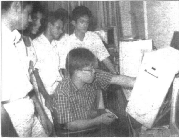
මහරගම පරිගණක පුහුණුව ලබන සිසුන්