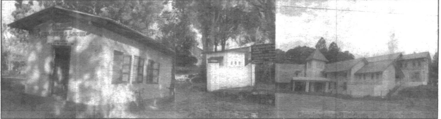
මහලපුව යෞවන සමාජ පුස්තකාලය

ජාතික තරුණ සේවා සභාව මගින් තරුණ පෙළට විවිධ වෘත්තීන්හි පුහුණුව ලබාදීමේ අරමුණෙන් පුහුණු මධ්‍යස්ථානය ආශ්‍රිතව වෘත්තීය පුහුණු පාඨමාලා පවත්වාගෙන යනු ලැබේ. මෝටර් කාර්මික, අත්කම්, වඩුවැඩ, මේසන් වැඩ, වැද්දුම්, පැස්සුම්, විදුලි වසරිං, රියදුරු, මැණික්