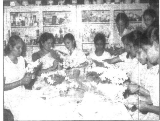
මහරගම රූපලාවන්‍ය කාඩ්මාලාව හදාරන සිසුවියන්

තරගකාරිත්වය සහ ජයග්‍රහණය පිළිබඳ හැඟීම් සඳහා දිරි ගැන්වීම