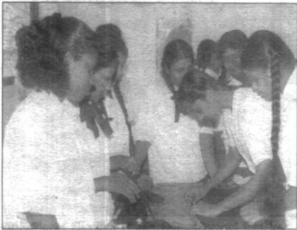
වරමිණියා වෘත්තීය පුහුණු මධ්‍යස්ථානයේ සිසුවියන්