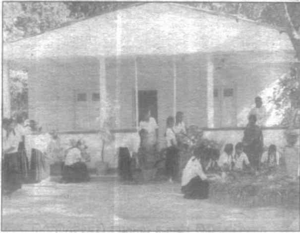
සිරාබැඳිවැව කාන්තා පුහුණු මධ්‍යස්ථානය