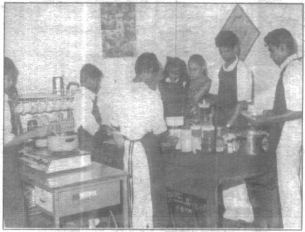
මුලත්සිංහල වෘත්තීය පුහුණු මධ්‍යස්ථානය

වෙමින් පවතී. තරුණ පෙළේ නියත කලා කුසලතාවයන් දියුණු කර ගැනීමටත්, එම ගැතිකමක් සෙසු ළොවට ඉදිරිපත් කිරීමට අවස්ථා ලබාදීමත් සංස්කෘතික කටයුතුවලදී තරුණ සහභාගිත්වය වැඩි කිරීමත් මෙම වැඩපිළිවෙලේ අරමුණු අතර වේ. වාර්ෂික යොවන සම්මාන තරගාවලිය මගින් දිවයිනේ තරුණ පිරිසට ස්වකීය කලා සොන්දර්ශ, විද්‍යාත්මක සහ නව සොයා ගැනීම් යන අංශයන්ට අදාළව සංවිධානය වී ඇති තාට්‍ය, මුද්‍රා තාට්‍ය, සංගීතය, ජන ගී, කැටුම්, මැජික්, රූකඩ, පර්ගණක වැඩසටහන් ආදී තරග අංශ යටතේ සමස්ත ලංකා මට්ටමේ තරගයකට මුහුණ දෙමින් ගැතිකමක් උරගා බැලීමේ මහඟු අවස්ථාවක් උද වී ඇත. දිවයිනේ සෑම ප්‍රදේශයක් ම පාහේ නියෝජනය වන පරිදි විශාල තරුණ පිරිසක් අවුරුදු පහා මෙම තරගාවලියට සහභාගි වෙති. සමහරු ඉන් ලද ජයග්‍රහණයන් හා පෙළඹවීම් ඔස්සේ ඊට අදාළව වෘත්තීය අංශයන් කරා ද සාර්ථකව ළඟා වී සිටිති.