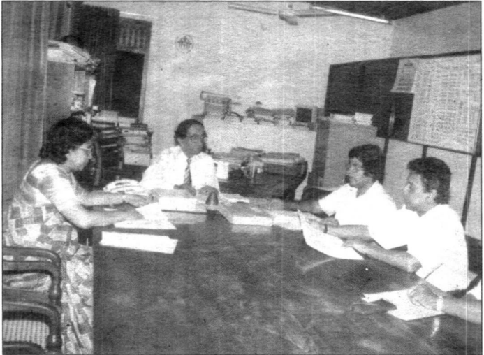
අධ්‍යක්ෂ ජනරාල් හා සංගණන අධිකාරී විමල් තානායකාර මහතා සංගණනය පිළිබඳ සිය නිලධාරීන් කීප දෙනෙකු සමග සාකච්චාවක