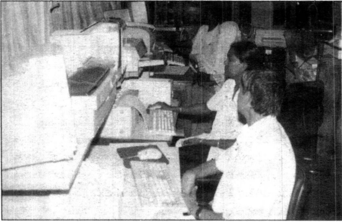
සංගණන අංශයේ පරිගණක වලින් අවශ්‍ය ලිපි ලේඛන සැලසුම් කිරීම