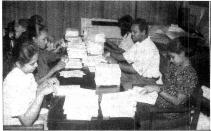
සංගණන අංශය විසින් ඊට අදාළ ලිපි ලේඛන හා පොත්පත් තෝරා ඒවා අදාළ අයට යැවීම සඳහා සැලසුම් කරන අයුරු